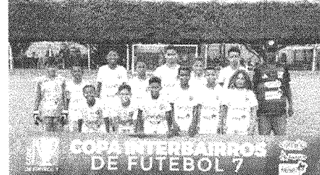
Futuro do São Francisco classificado para as semifinais do torneio Sub-13