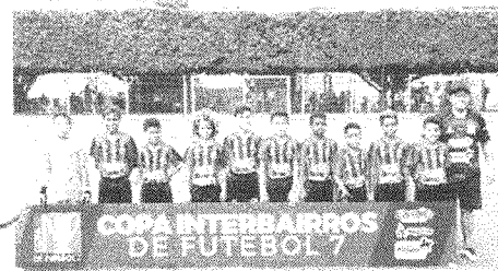
Futuro do São Francisco classificado para as semifinais do torneio Sub-11

A segunda rodada da Copa Interbairros de Futebol 7, competição patrocinada pelo governo do Estado e pelo El Camião Supermercados por meio da Lei de Incentivo ao Esporte e que possui o apoio da Federação Maranhense de Futebol 7, foi encerrada neste domingo (27) com a realização de mais quatro partidas no campo da A&D Eventos, no Turu. Com o término da jornada deste fim de semana, foram conhecidos os primeiros times classificados para as semifinais do torneio com uma rodada de antecedência.